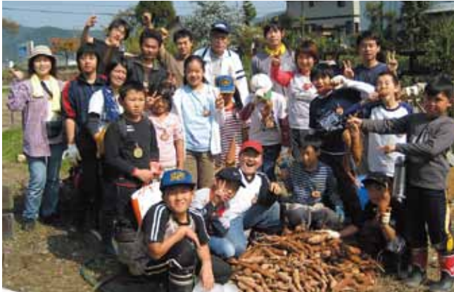
■ 子ども達の笑顔がなにより楽しみです。

「どやの」とは、福井弁で「どうですか?」「いかがですか?」という意味で、ボランティア活動などちょっと始めてみませんか?という思いが込められています。