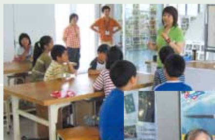
■ 子ども達との語らいに、学ぶこともあります。

「人との出会い」ですね! 大阪から鯖江に来て全くの天涯孤独だった私が、こんなに仲間が増えました。「土曜塾」には、毎回多くの若いボランティアスタッフたちが参加してくれて、本当に有難いです。PTAから始まったお友達づくりが、NPOセンターに出入りするきっかけとなり、市民活動の場での仲間づくりとなりました。人との出会いは私の財産、友人やスタッフという仲間は宝物です。