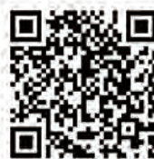
▲「市民主役」の歩みへ

http://sabae-npo.org/shiminsyuyaku/wp/sbns2021/