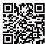
▲お申込フォームへ

認定NPO法人 さばえNPOサポート 〒916-0024 鯖江市長泉寺町1-9-20 TEL : 0778-54-7055 FAX : 0778-54-7058 E-mail : info@sabae-npo.org