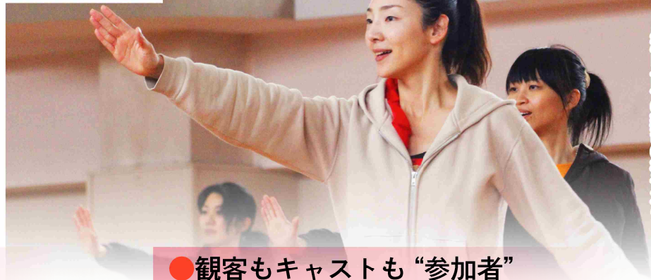
◀1月29日(日)の練習の様子から