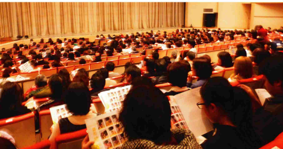
▲26日(日)開演前の観客席でも熱気がムンムン